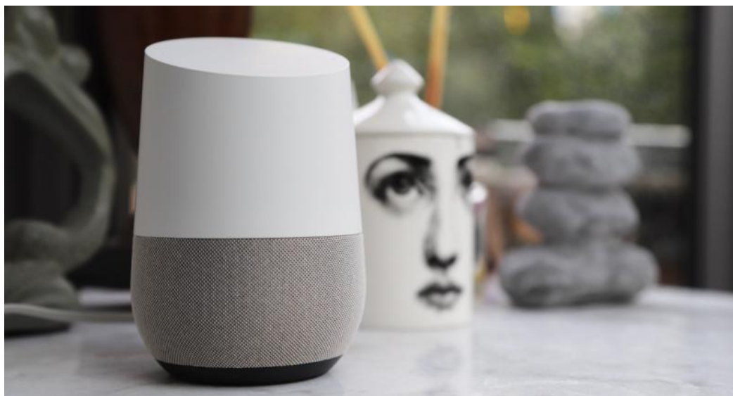
Google Home

Il y en a pour tous les goûts ! Les amateurs de fêtes entre amis trouveront leur bonheur avec les enceintes son & lumière telles que les JBL Pulse et leurs effets lumineux colorés (notre préféré : le feu de camp orangé mimant le crépitant du bois et des étincelles). Pour du gros son de qualité, bien déployé et bien puissant, l'appairage stéréo à plusieurs enceintes est un véritable atout. Si vous souhaitez profiter d'une playlist directement depuis un périphérique plutôt que de passer par du streaming et du Bluetooth / Wi-fi, sachez qu'il existe même des enceintes avec port de carte micro-SD intégré ! Enfin, la plupart